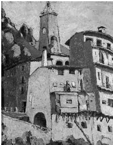
La torre del rellotge de Camprodon (ca. 1955)

Ell mateix, en una entrevista que li realitzà el crític d'art de la revista Destino , edició d'abril de 1957, defineix el seu estil com segueix: "una pintura allunyada de les directrius de l'impressionisme alemany i més propera a un expressionisme de caire mediterrani, d'intensitat cromàtica, proper al francès... una mica seguint l'exemple del pintor Roualt..."