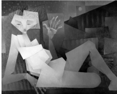
Salutació (ca. 1985)